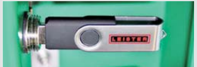
USB 记忆卡确保使用 EXAMO 可以获得能够验证的焊接结果。

139.059 EXAMO 300F USB, 230 V / 200 W · 含 USB 记忆卡 · 配欧标插头 139.060 EXAMO 600F USB, 230 V / 200 W · 含 USB 记忆卡 · 配欧标插头